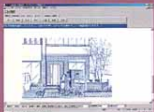
出図修正画面イメージ

2000年1月にスーパー御庭番のVER1.5がリリースされた。今回のバージョンアップでは、出図修正画面のスーパー御庭番完全対応、および'99年秋の新商品データの追加を行う。