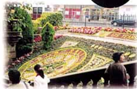
エジンバラの素晴らしい花時計

「イングリッシュガーデン」の素晴らしさは世界の周知するところですが、実際に訪れて思う事は、庭や植物、人々の花に対する思い入れと景観を大切に育む英国人のライフスタイル、その歴史とガーデン文化、さすが「園芸王国」の感を拭えません。日本との違いを何より強く感じたのは、石造りの建物文化ゆえの美しさと空間構成のバランスの良さです。田舎の建物は実にシンプルですが、植物とのコーディネートがうまく何とも豊かな演出がなされています。白夜のせいでしょうか？いつまでも暮れない庭に、帰宅した人達が一所懸命手を加えていました。時間がたっぷりあるのか、使い方がうまいのか、昔から庭いじりが人々の日課に定着しているのですね。共に景観づくりに励むという意識の中で、隣人とも良い関係になっているのではないのでしょうか。日本でも昔はそうであった筈なのですが…。数多くのスナップ写真の中から、いくつかをご紹介します。