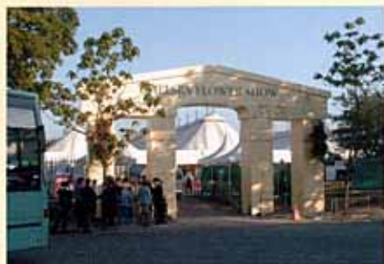
4日間で20万人を超える人が押し寄せたエントランス 主催は英国王立園芸協会

86年の歴史をもつ国民の誇りのひとつ、花と庭好きの英国人が待ちこがれる祭典「切尔西フラワーショー」が99年5月に行われた。