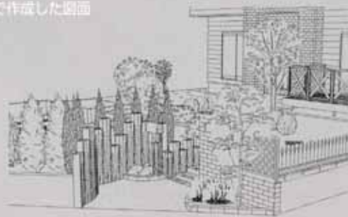
御庭番で作成した図面

アプローチのベープ、階段、そしてバックの建物との調和を図るための「御庭番」活用が見事に現実のものとして生きた。ソフト感と自然への“やさしさ”が写真の画面から伝わってくる。