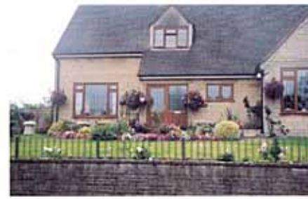
さりげないポケットパークも贅沢な空間