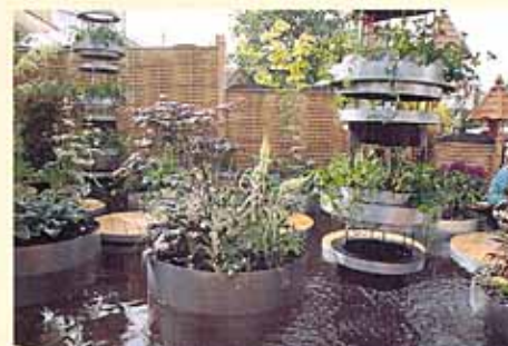
タワーから水が落ち、水面を浮遊するプランター…やすらぎのフローティング・ガーデン