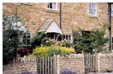
小さな庭も素材の組み合わせの工夫が感じられる