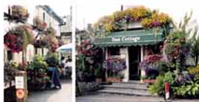
どこへ行っても花盛り、組み合わせがとても美しい建物のフロントも立派なウォールガーデンに

見渡す限りのなだらかな丘陵に、溢れんばかりの花に飾られた家々が点在するカントリーサイド…今もその情景が臉の奥に強く焼き付けられています。私にとって初めてのイギリスの旅は、スコットランドの首都エジンバラを起点に、ピーターラビットの故郷・湖水地方を経てシェークスピアカントリー、蜂蜜の家並みが印象的なコッツフォルズ、そしてオックスフォードまでの約2000キロ…車窓からの眺めに心を奪われ、あっという間の7泊8日でした。