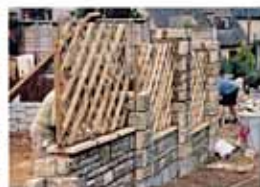
街で見かけたEX工事、石組にウッドフェンスが映える