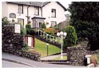
自然石と芝生、手垢が美しく調和したエントランス