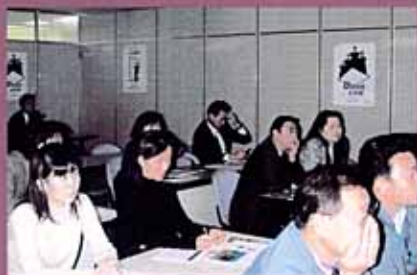
関西EX支店での情報交換会風景