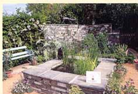
ピーターラビットの世界をテーマにした野菜畑のあるマクレガーズ・ガーデン