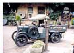
田舎の庭の一角もなんとなくおしゃれな小物が溢れる