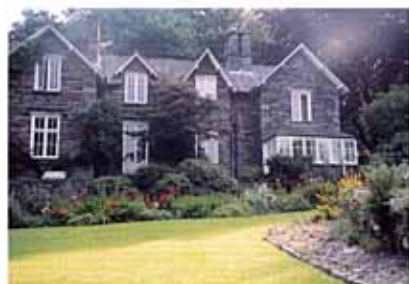
素晴らしい典型的なコテージガーデンは花が次々咲くように開花サイクルを考えてある