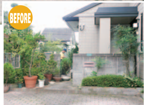
【エクステリア全景】 奥の塀を取りはらい、カースペースを手前に2台、奥に1台分確保。敷地と建物の形に合わせてUスタイルをL字に設置しました。屋根の一部をパーゴラ仕様にしたので、爽やかなアプローチにも。