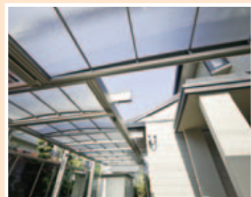
【敷地対応力③建物に合わせて凹凸】 玄関部分の出っばりをうまくよけて、Uスタイルの屋根をL字に接続。車から玄関まで濡れず出入りできます。