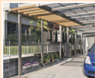
【敷地対応力①柱の位置が自由】 既存のレンガ製のプランターボックスを巧みによって柱を設置。柱が邪魔になりません。