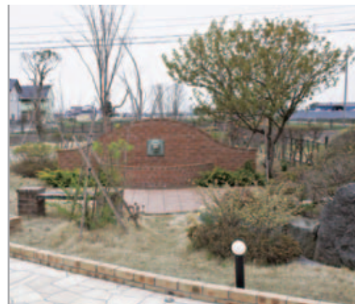
【壁泉のある洋風庭】 レンガでつくった壁泉がフォーカルポイントになって、落ち着いた風格のある庭に。奥の木々が芽吹くと、雑木林のような自然な庭になります。