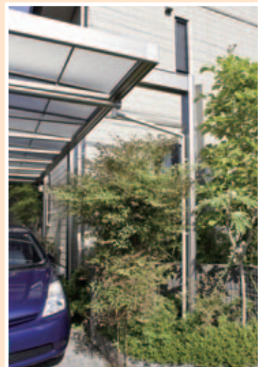
【敷地対応力②梁を飛ばす】 梁を延長して柱を植え込みに逃がしているの、邪魔にならず、車の出し入れもラクラク。