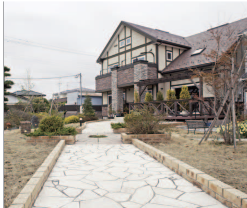
【アプローチ～外観全景】 山小屋風の洋館の雰囲気に合わせて、天然石乱張りのダイナミックなアプローチを設置。