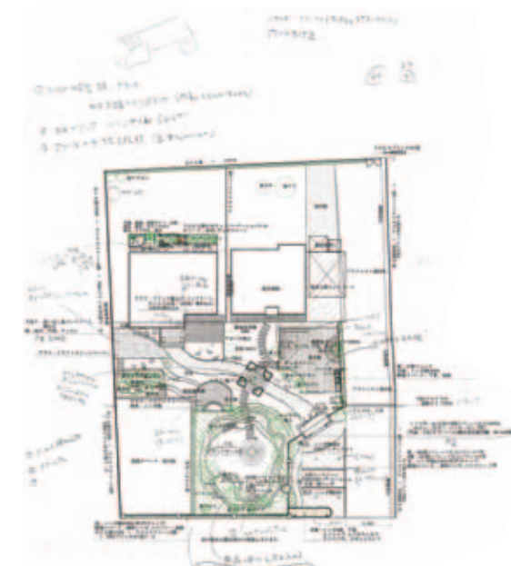
木の種類やレイアウトなどを何度も何度も話し合っ決めていたので、図面にはこんなに書き込みが。

父の代からの家と庭を全面建て替えて。登山が趣味で建てた山小屋風の家に合わせて、野趣のある自然な庭を、というのがH様のご希望。庭の木や石はもともとあったものを極力生かしました。地下室→池→川→壁泉と水が循環し、広い庭のアクセントになっています。(撮影時には水はなし)