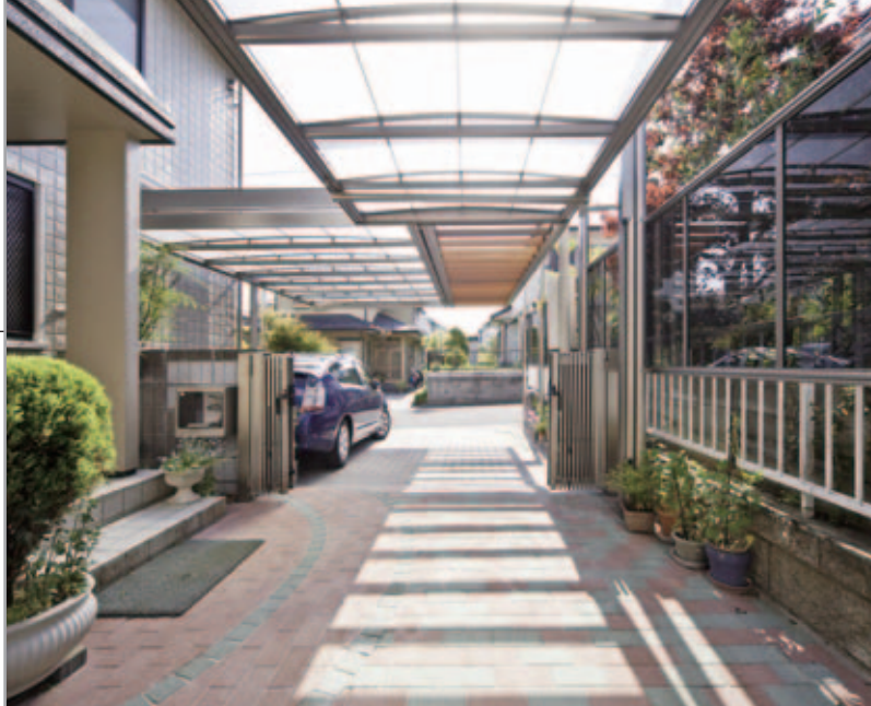
【奥から道路を見る】 以前は鉢がたくさん置かれていた場所を整えて1台分のカースペースに。床材は透水性のブロックを使ったので、雨の日でも足元すっきり。

ファサードの2台分の駐車場に屋根を探していたC様。他社のカーポートも検討しましたが、Uスタイルの敷地対応力が気に入られてリフォームを決定。鉢などを置いていた奥のスペースも一緒にして、UスタイルでL字のカースペースを設置しました。一部にパーゴラを組み込んだことで、アプローチらしい雰囲気もつくれて大満足とのこと。