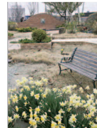
【水仙の群生】 球根が増えて野趣豊かに咲き乱れる水仙。ベンチでくつろぎながら花々を眺めるのも楽しい。