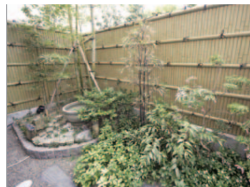
【和の坪庭】 裏庭は一角を囲い、六方石やつくばいをあしらって和の坪庭に。