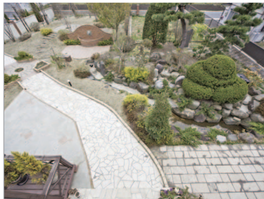
【庭の全景・俯瞰】 右が和風、左が洋風になっていて、和と洋を小川がつかないでいます。夏期には水の流れが楽しめる癒しの庭に。