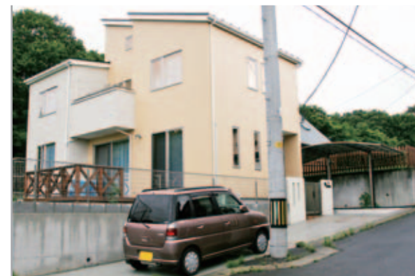
【エクステリア全景】 クリーム+アイボリーの淡い色調の建物に合わせて、門柱はアイボリーに。カーポートと門扉・フェンスはアーバングレーで統一。

「駐車場はオープンにして、庭は囲いたい」というご希望に沿って、駐車スペースの内側に門扉フェンスを設置。門から玄関までの距離がなく、ステップが迫っているので、門扉は扉式でなくスライドタイプを採用。カーポートは、積もった雪が隣家に落ちないようにとの要望で、前後にアールのついたデザインに。アーバングレーで統一したので、淡い色調の建物とも絶妙に調和しています。