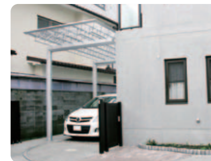
【敷地対応力】 スペースに合わせてスッキリと納まったM.シェード。限られた空間を有効に使えます。建物とのイメージもぴったり。