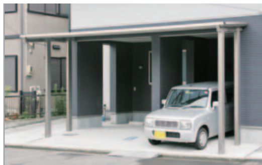
【ルーフ+ガレージ】 建物の前の敷地は台形になっています。その形状に合わせてルーフフェスのルーフを台形に加工。境界線までぴったりと納めています。左側の柱が前に出ないため、車の出し入れがしやすいと好評。