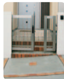
【玄関アプローチ】 コンクリートの床にレンガで格子模様を描き、アプローチのアクセントに。門からすぐにステップで、扉式の門扉だと引っかかってしまうため、スライド門扉を採用。