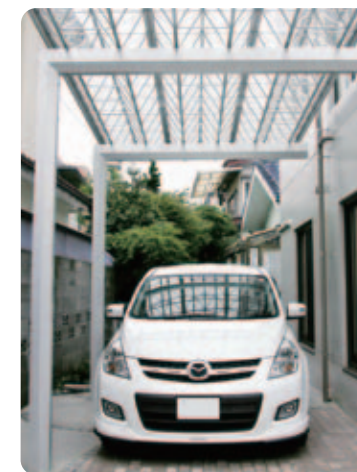
【M.シェード】 透明パネル使用で、屋根の下でもこんなに明るい。片支持で柱が少ないので、車の出し入れもスムーズです。