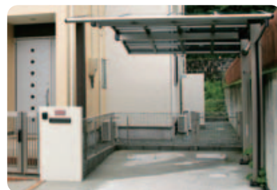
【2つの入り口】 カーポートの奥にもう一つ門扉を設置。車から降りて、買い物の荷物をここから奥の勝手口へ運べるので便利です。門扉はメッシュフェンスとハンヨウ型材を使って現場施工。