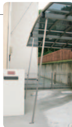
【着脱サポート柱】 カーポートは片支持なので、強風の場合など屋根が煽られないように、着脱式のサポート柱が付けられます。