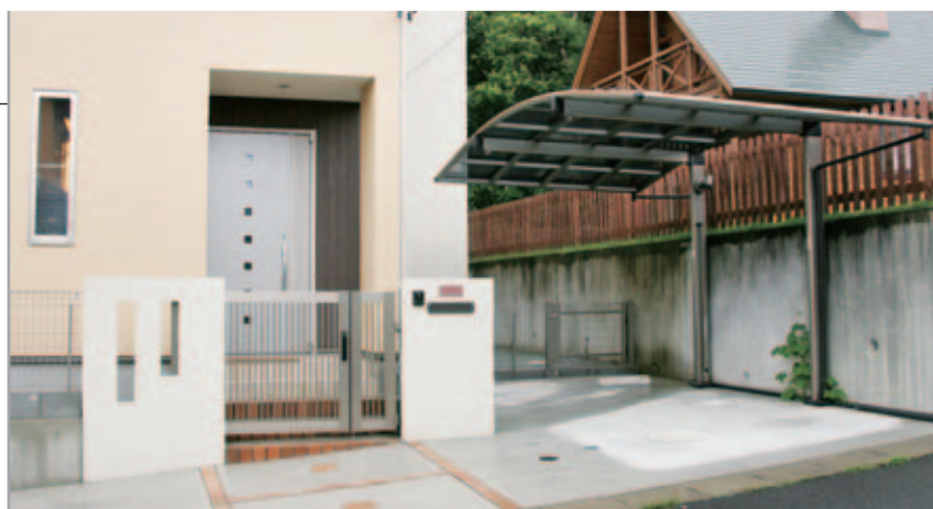
【門扉とカーポート】 門扉はカムフィ2型、フェンスはメッシュフェンス。カーポートはマリード。屋根の傾斜が前後なので隣家に雪が落ちる心配がなく、手前に柱のない片支持タイプなので、スペースが広く使えて車の出し入れが楽です。