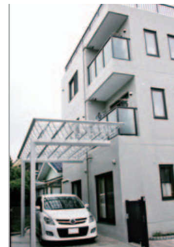
【エクステリア全景】 3階建ての建物とのバランスを考え、M.シェードは高さが一番高い3mのものを採用。コンクリート打ちっ放しのモダンな外観にシャープなシルバーが美しく調和しています。