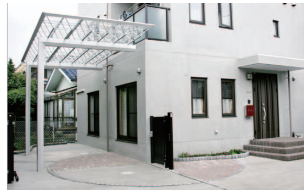
【テラス】 M.シェードは車を置かないときはテラスとしても使用。床にピンコ口とレンガで幾何学模様を描き、家族で楽しめるスペースに。伸縮門扉はペットが中で走れるように設置。