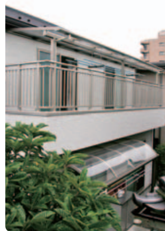
【テラス屋根】 庭側のテラスには、上下階ともテラス屋根・グッドエバーを設置。アーバングレーの色調が手すりや窓枠とも合って、建物に自然に溶け込んでいます。これだけ屋根があれば、洗濯物を干したまま外出しても安心です。