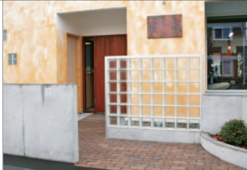
【アプローチ】 入り口には手前にアルミ枠のガラスブロックの仕切りを立てて、道路から入り口をさりげなく目隠し。レンガの床の暖かみがお客様を中へいざないます。