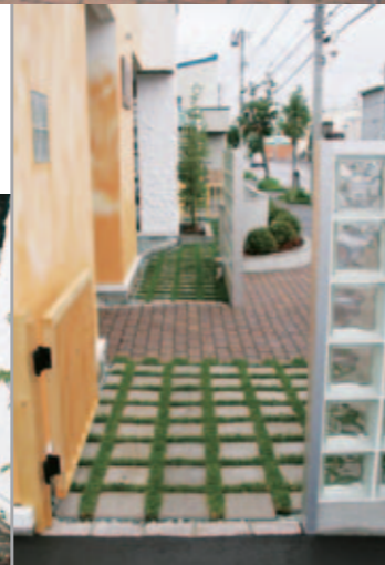
【左端から見る】 角芝平板の床が美しい。レンガもオーナーの希望で隙間をあけて敷いたので、いずれ間に草が生え、より風合いのある床面に。