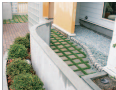
【多彩な床と曲線使い】 レンガ・角芝平板・御影砂利を使い分けた床と、塀や縁石の曲線が、多彩な表情をつくっています。