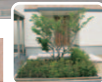
【植栽】 手入れが楽なように植栽は、一カ所にまとめて。シンボルツリーはチシマザクラです。