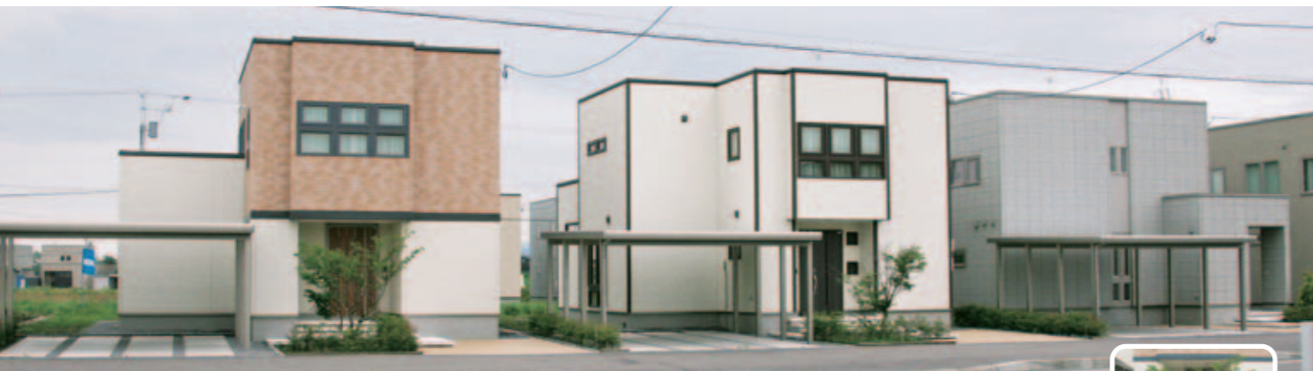
【エクステリア全景】 隣合う3棟の住宅に、それぞれツインZを設置。直線的なラインとアーバングレーの色調が、シンプルモダンの建物に美しく調和しています。