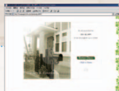
HPは奥様が作成。会社創設と同時に立ち上げ、これまで手がけた施工例などを載せています。