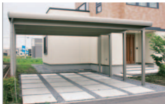
【カーポート】 車が2台納まるツインZ。積雪対応150cmの堅牢なつくりですが、ライトな色合いなので重苦しさなくすっきりとした印象。

ハウスメーカーから依頼され、連棟のエクステリアをプランニング。条件は「2台駐車のカバー」と「植栽」を入れること。そこでツインZを採用、床材を工夫しておしゃれに仕上げました。植栽は北国の春を楽しめるように、春に花の咲く木を選びました。