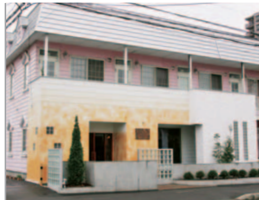
【エクステリア全景】 建物の一角にある美容室。オレンジ色の外壁に、コンクリートとアルミを基調にしたクールな塀が調和してハイセンスな雰囲気。

オーナーは「ガラスブロックなどを使ってシンプル&シックに」とご要望。そこで格子をモチーフに、コンクリートやアルミで無彩色にまとめました。塀や花壇のラインはアールにしてやさしさもプラス。アプローチにはレンガを敷いて、暖かくお客様をお迎えしています。