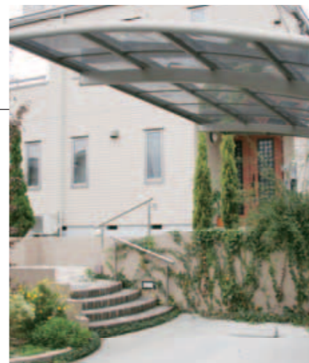
【右の階段】 右のカーポートから見たところ。こちらにもアプローチの階段があり、上がったところで左の階段とつながります。

ご要望は「オープン外構で、建物に合わせた色使いに」。高低差のある敷地を曲線的な塀と階段で柔らかくつなげ、アクセントの植栽でさりげなく目隠し。色は奥様が屋内展示場でサンプルを見ながらセレクトされたとのこと。建物と美しく調和したエクステリアに仕上がりました。