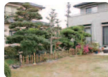
【和の庭】 庭の左側には既存の和の庭が残され、新しい洋風の庭とも調和。慣れ親しんだ景色が庭に落ち着きをもたらしています。