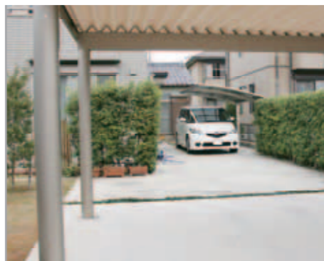
【奥にもカーポート】 G-1の奥には1台用のカーポート・カムフィアも設置。柱が邪魔にならず、出入りもスムーズです。