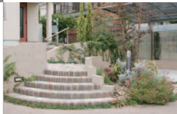
【左の階段】 メインアプローチの階段。優しい曲線が訪れる人をやさしく迎えてくれます。天然石の乱貼り、レンガの縁取り、コテ荒らし仕上げの塀などの組み合わせも絶妙。