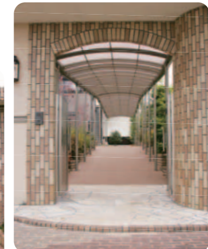
【門~アプローチ】 門扉を開けたところ。建物まで延びる長いアプローチには屋根がついています。