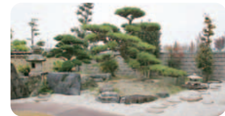
【和の庭】 以前住んでいたところから庭石や灯籠などを持ち込んで和風の庭に。懐かしい風景にご両親も喜んでのこと。

広大な敷地に建てられた二世帯住宅。車は車庫に5台+ゲスト用に車庫前に数台駐められるようにのご要望。庭が広く、門から建物までの距離が長いので、アプローチには通路シェルター・プレラウォークで屋根を設けました。庭は以前お住まいのところから庭石などを持ち込んで和風に。ご両親も満足の上上がりです。