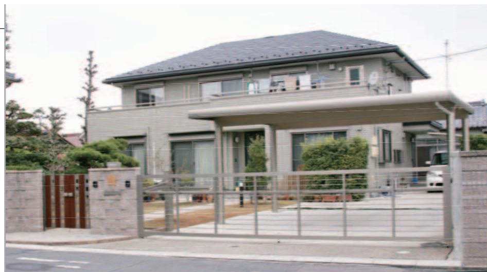
【エクステリア全景】 古い和の庭と新しい建物を調和させた和洋折衷プラン。カーポートはG-1、跳ね上げ門扉はエクモアワイド、UC(アーバングレー)色がグレイッシュな建物とマッチして落ち着いた外観に。