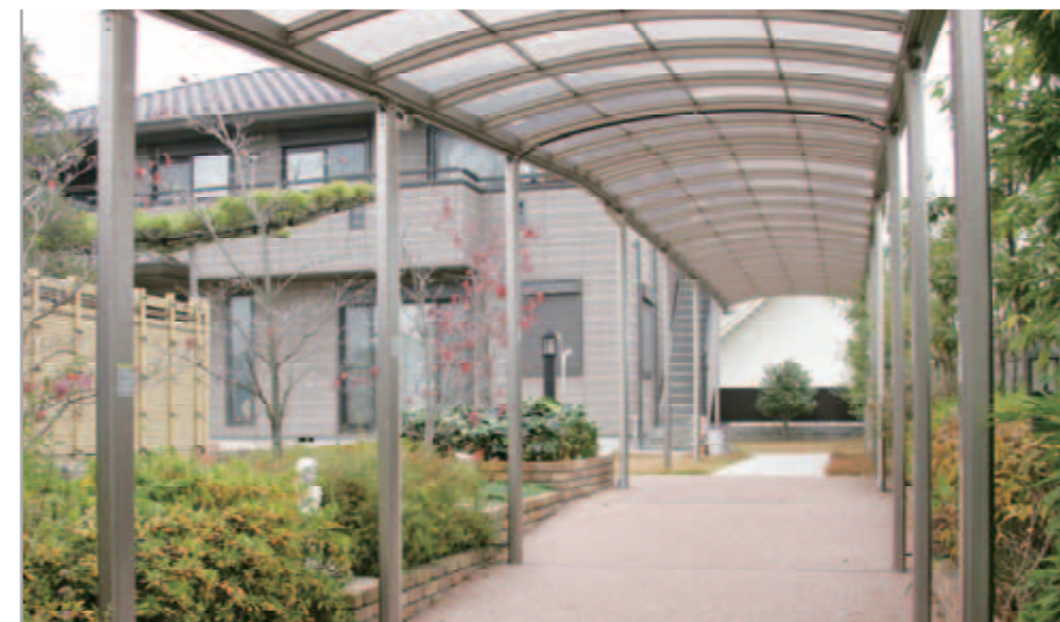
【屋根つきアプローチ】 アプローチの屋根はプレラウォークを採用。透明屋根のため明るさや景色を損ないません。これがあるので、雨の朝の新聞取りも苦にならないそうです。