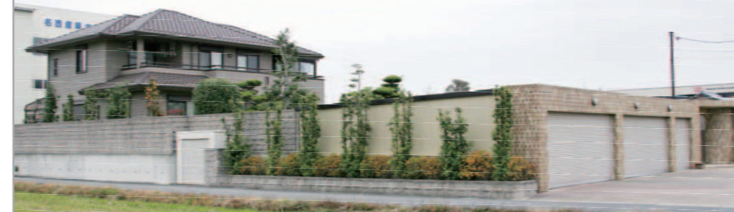
【エクステリア全景】 5台分の車庫と長い塀が続く広大な敷地。外観は洋風ですが、庭は純和風になっています。