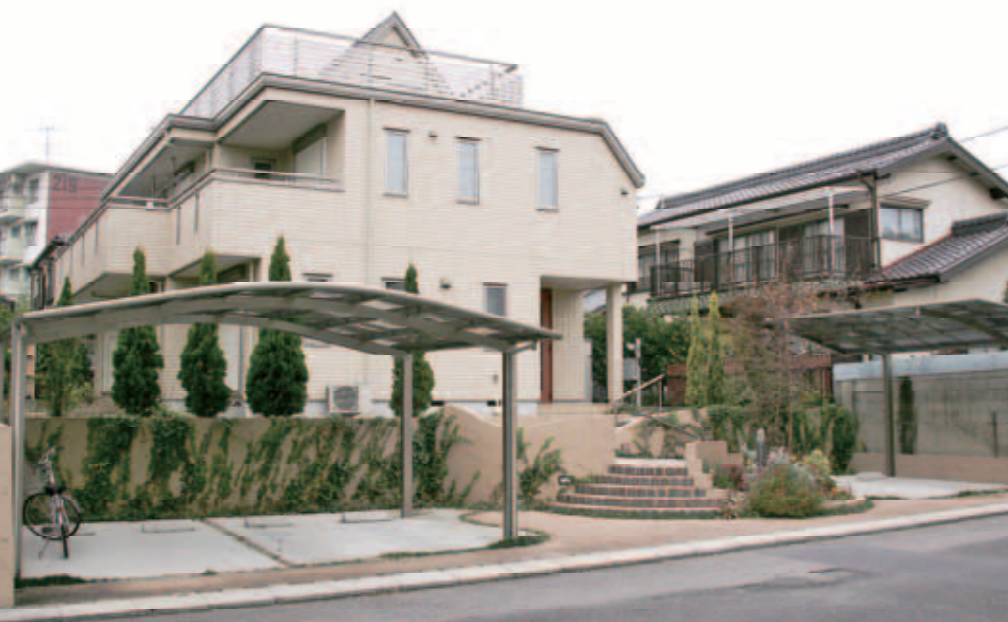
曲線と植栽がアクセントのオープンファサード