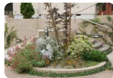
【植栽がアクセント】 2つの階段にはさまれた植栽は美しいアクセントになっています。道からの視線をさりげなく遮る役割も。