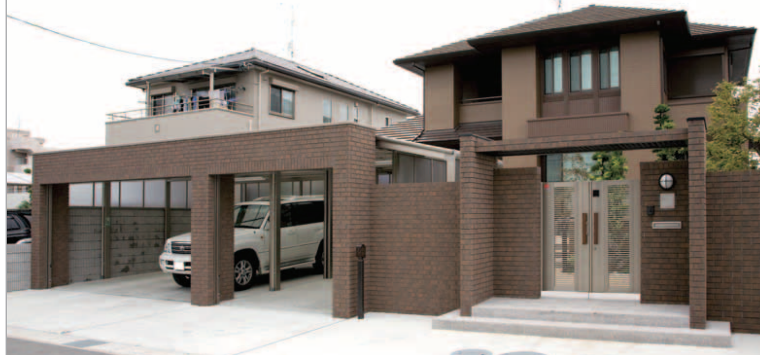
【エクステリア全景】 建物と色を合わせたタイル仕上げの門扉とシャッターゲート。重厚感と風格のあるクローズドなエクステリア。門扉はピラレシア2型電気錠仕様。