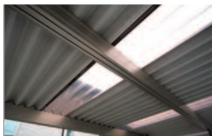
【カーポートの屋根】 一部透明ポリカーボネート仕様になっているため、明るさもしっかり確保。