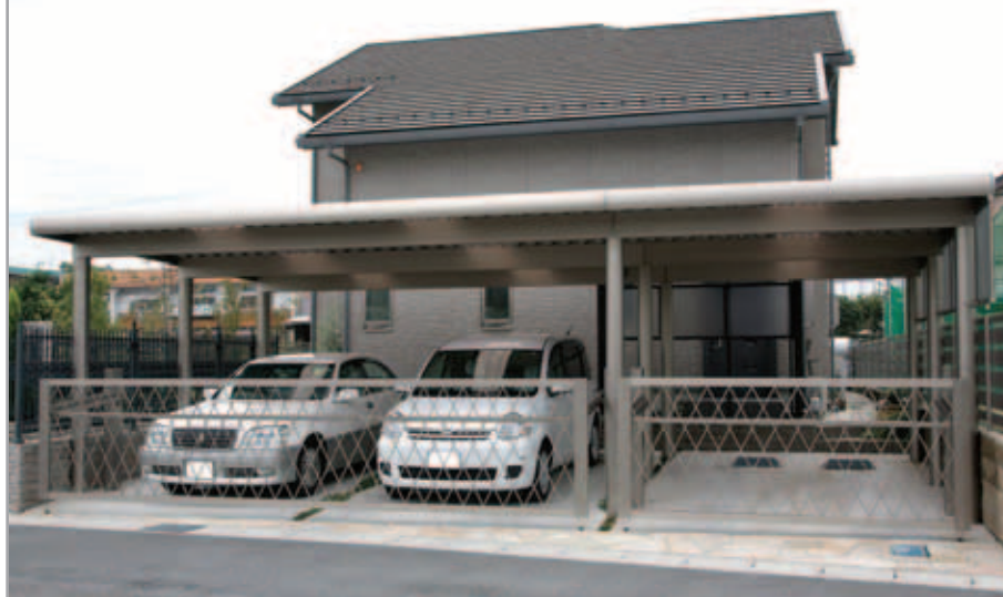
【エクステリア全景】 グレーベージュ系に統一された外観に落ち着きと風格が。カーポートの前面に設置された跳ね上げ門扉エクモア4型は、1台用と2台用では格子柄の大きさが違うのですが、特注で揃えたためバランスよく納まりました。

「3台分の駐車場」「庭の一面に和の雰囲気」をご要望のI様は、素材やデザイン一つひとつを吟味されるこだわり派。プランが固まるまで何度も何度も変更し練り直したそうです。その甲斐があり、カーポートも和洋折衷の庭もほぼ施主様の思い通りになり、建物との調和もとれたエクステリアが完成。「若大将（関谷様のこと）が頑張ってくれたので」と満足そうなI様夫妻でした。