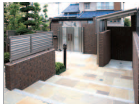
【玄関から門を見る】 アプローチの階段が2つに別れ、左が門、右が駐車場へ。駐車場入り口の屋根にはサイクルポートを使用。