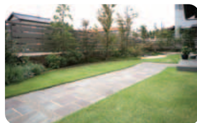
【アプローチ～芝生の庭】 細長い庭は、手前を洋、奥を和の雰囲気。アプローチは鉄平石の方形貼り。モダンな幾何学模様が美しい。