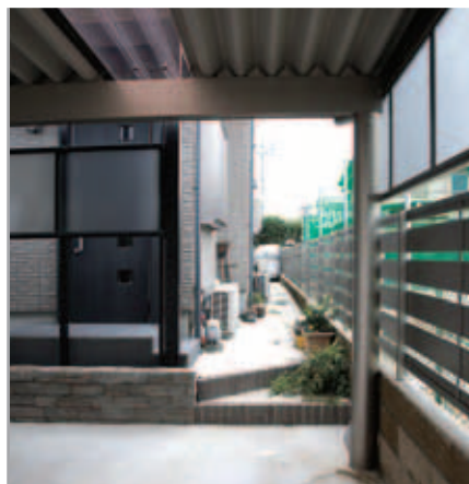
【カーポートの奥～勝手口へ】 車から降りて荷物を運び込むときにも便利。