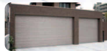
シャッターゲートを閉じると堅牢で、セキュリティも万全。