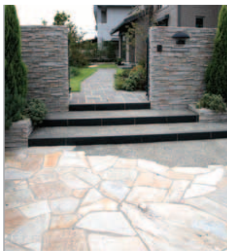
【門～アプローチ】 雰囲気のある石造りの門まわり。天然石の乱貼りや、鉄平石の方形貼りなど、床材も一つひとつ吟味して、奥行きのあるアプローチに変化をつけています。