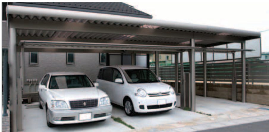
【カーポート】 跳ね上げ門扉を上げたところ。カーポートはG-1を採用。直線美が建物の外観ともマッチ。