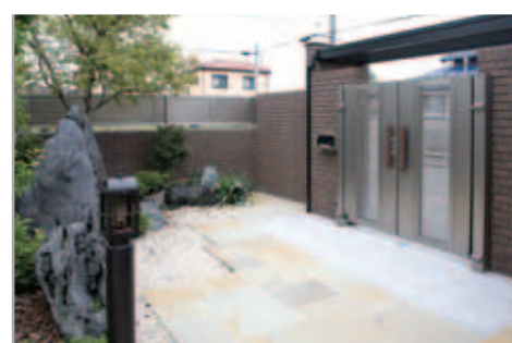
【門扉の内側】 落ち着いた和風のしつらえに重厚な門扉が調和しています。床材もサンドストーンと御影石を使い分けて高級感を。