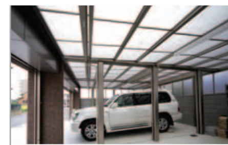
【駐車場の屋根】 Uスタイルを採用しているため、中は明るい。3台分のシャッターゲートの広い間口に合わせられたのはUスタイルだけだったとのこと。屋根パネルは熱線遮断仕様。