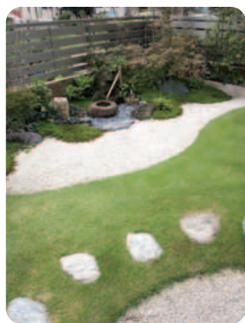
【和の庭】 奥の和室の前には和の坪庭が。白砂利を組み合わせることで、芝生とも違和感なくマッチし、新感覚の和の雰囲気。