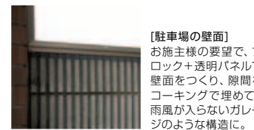
【駐車場の壁面】 お施主様の要望で、ブロック+透明パネルで壁面をつくり、隙間をコーキングで埋めて、雨風が入らないガレージのような構造に。