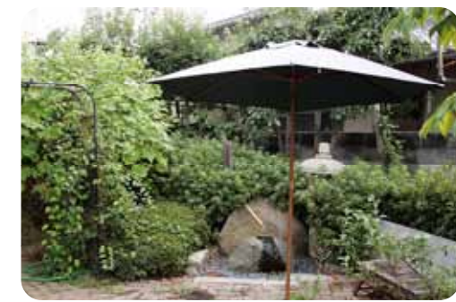
【緑の中庭】 テラスの前に広がる中庭は、和洋折衷の落ち着いた雰囲気。パラソルを立ててここで過ごすのも心地よい。