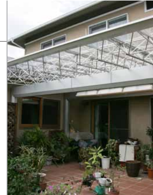
【中庭にM.シェード】 中庭のテラスの上にM.シェードを設置。明るくて快適だし、雨が降っても濡れないので洗濯物も安心して干せるとのこと。