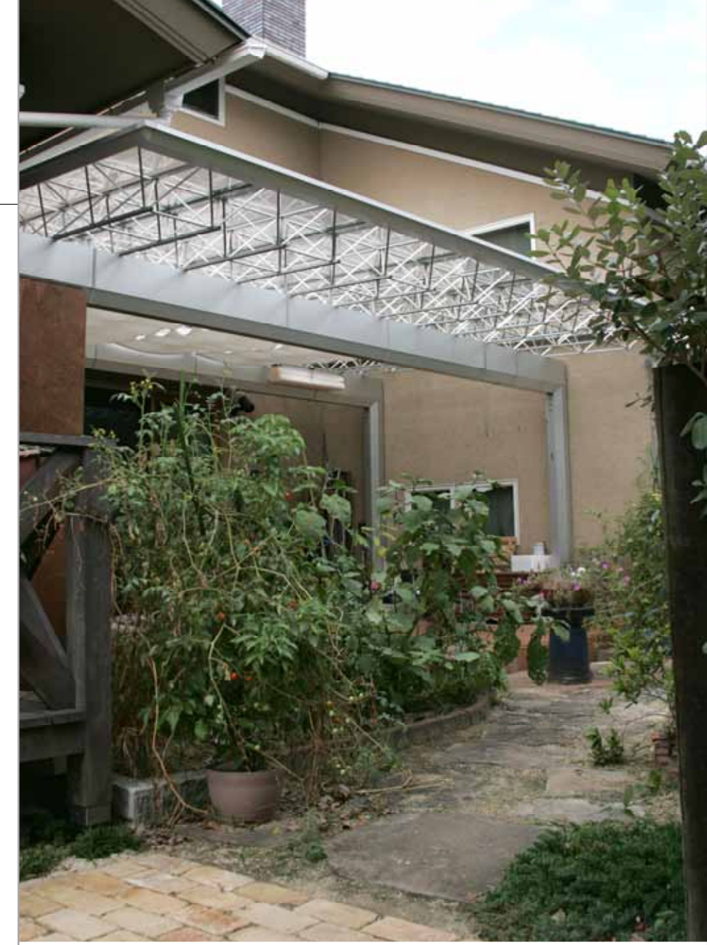
【コの字のテラスにフィット ③】 建物でコの字に囲まれた部分に設置されたM.シェード。サイズの融通がきき、敷地適応力があるので、後付けでもこんなにぴったりフィット。