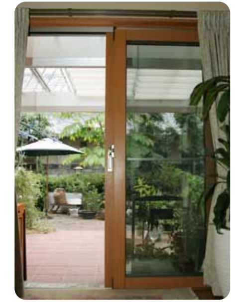
【室内からテラスと中庭を見る】 屋根が透明なM.シェードだから、テラスが暗くならず、室内から見ても明るくて気持ちがいい。