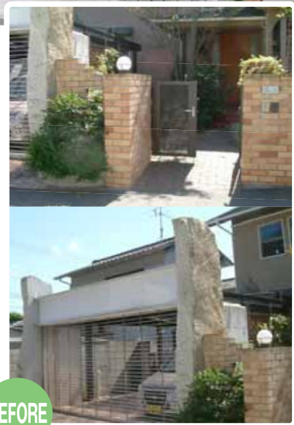
【門まわり全景 ①】 カーポート両脇の天然石柱は、リフォーム前からのもの。以前は石の迫力にまわりが負けていましたが、リフォーム後はバランスよく納まっています。