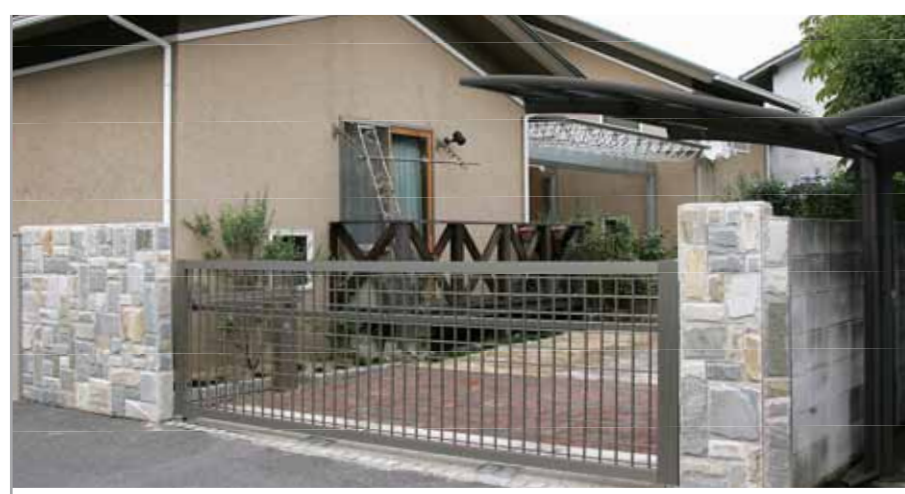
【カーポートの門扉 ②】 中庭の脇にある駐車場には、跳ね上げ門扉エクモア2型ワイドタイプを採用。電動で開閉するので便利だし、防犯上も安心です。