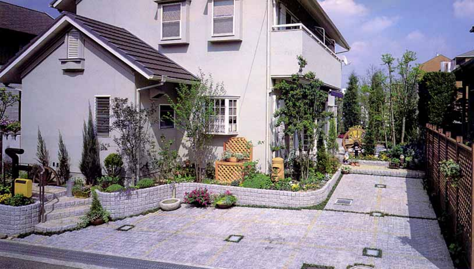
大阪府箕面市 1邸 駐車場側からの景観