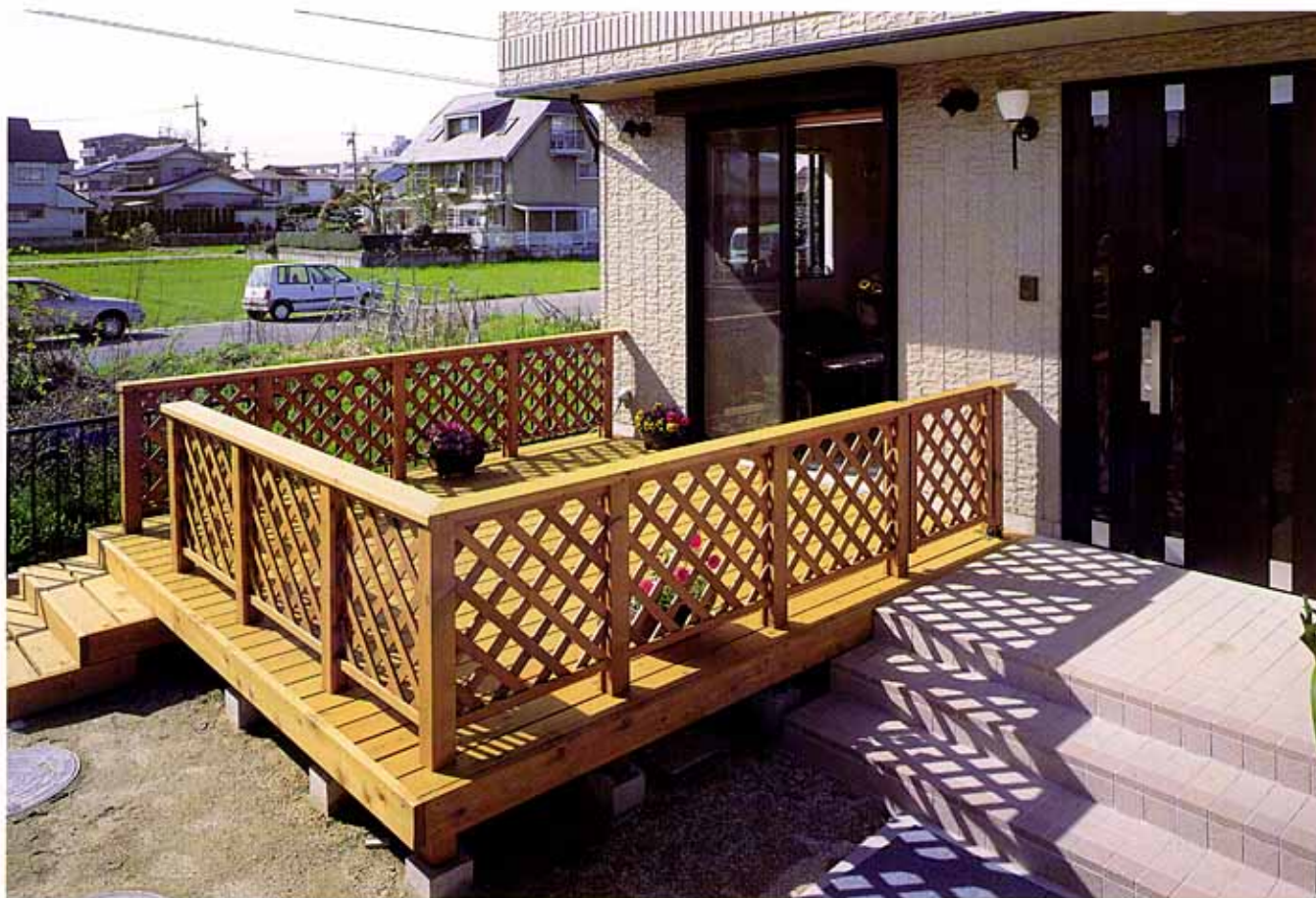
愛知県木曾川町 K邸