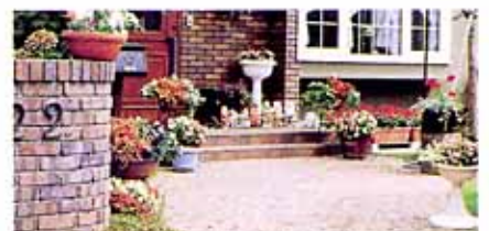
(株) スズキグリーン様の設計事例

高齢の方には、元気がでて活発な気分になせさせるガーデニングを…。また、一般に夏は涼しげな落ち着かせる色の花がおすすです。