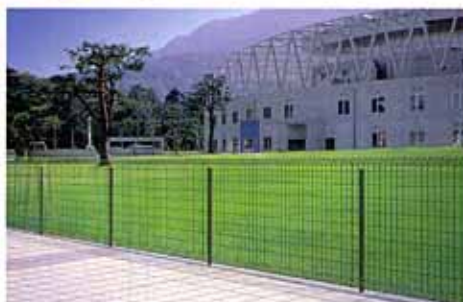
フェンス 間仕切り支柱タイプ

開放的な景観を提供するスチールメッシュシリーズのニューデザインです。フェンスには、間仕切り支柱タイプとフリー支柱タイプがあります。