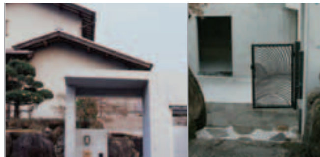
【アプローチから門へ】 アプローチの階段の新旧のつなぎ目は、わざと変化をもたせて楽しく演出。手前の古い石と、奥のシンプルなコンクリートのコントラストが美しく、そこに鉄物門扉の造形がアクセントになっています。

築30年で老朽化し、全体的に使い勝手が悪くなっていたガレージまわりをリフォーム。勾配が急なうえに前の道の交通量が多く、車の出し入れが難しいのを改善してほしい、防犯も考慮してほしい……といったご要望をもとに、勾配をゆるやかにして車を出しやすくした、コンクリート打ち放し仕上げのエントランスを提案。既存の古い石組みとの調和が絶妙で、斬新な和モダンの雰囲気は、3世代のご家族全員から喜ばれました。