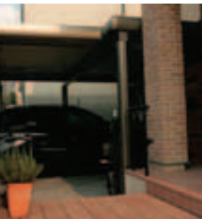
【カーポートの屋根】 屋根はシルバー色の折板ですが、一部に透明のポリカーボネートを組み込んだため明るく、車の作業もしやすいと好評です。奥に見える木製の物置はご主人の手づくり。中には車関係のパーツや工具がぎっしり収納されています。