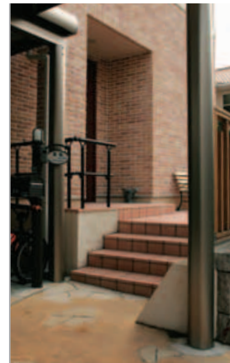
【アプローチ】 ウッドフェンスに合わせて床も貼り替え、ナチュラルな雰囲気に。カーポートの柱を邪魔にならないところに逃がすことができたため、アプローチへの動線がスムーズ。これも「スーパーポートG1」の特長のひとつです。手すりは「エトランボ」。