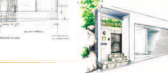
【ガレージ部分】 オープンなボックスガレージで、2台の車を駐車できるガレージ。この写真ではシャッターが上がっていますが、車を使わないときはシャッターを下ろせば、前面がスッキリとした壁面になり、防犯上も安心です。