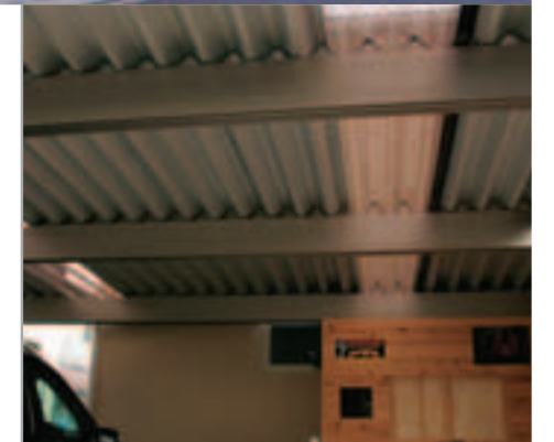
【カーポートの屋根】 屋根はシルバー色の折板ですが、一部に透明のポリカーボネートを組み込んだため明るく、車の作業もしやすいと好評です。奥に見える木製の物置はご主人の手づくり。中には車関係のパーツや工具がぎっしり収納されています。