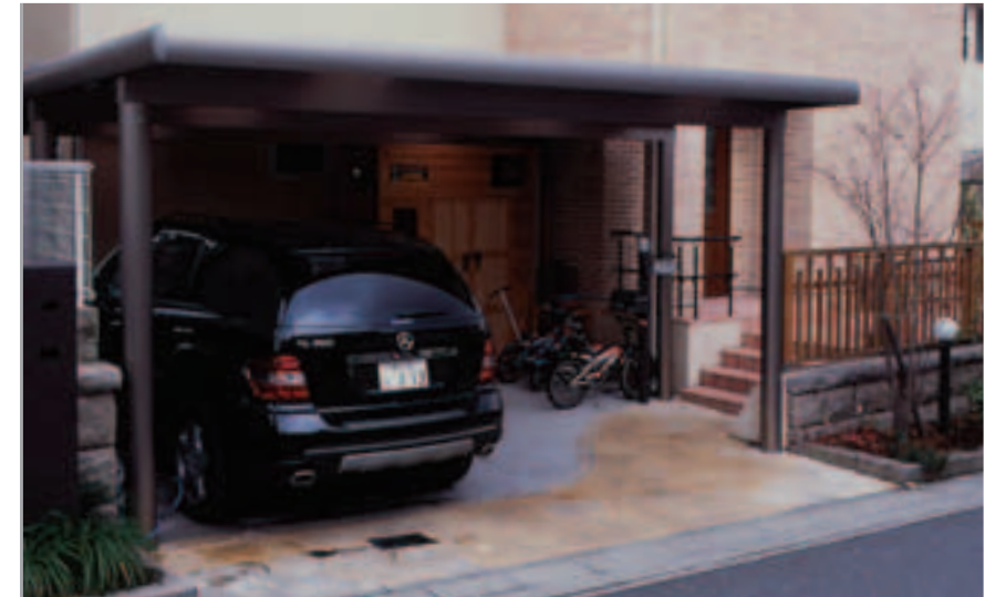
【大型カーポート】 カーポートには「スーパーポートG1」を採用。がっしりと骨太で直線的なフォルムが印象的です。アーバングレー色のために重く感じることなく、建物とも自然に調和しています。