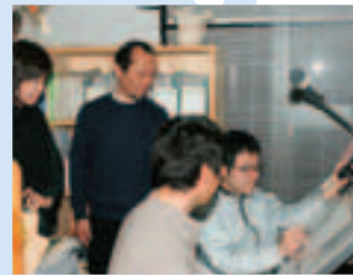
スタッフはプロ集団、全員が設計も営業もこなし、1人のお客さまを最後まで担当。製図は手描きです。

さらに、エクステリアは建築と土木の橋渡しをする重要なジャンルだと思います。ですからそういった関連分野の勉強もしていくように、折にふれて必要な本などをすすめています。