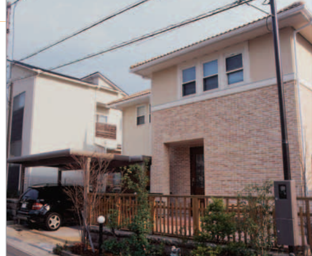
【エクステリア全景】 カーポート、アプローチ、フェンス部分などをリフォーム。アルミ製のカーポート、木製のフェンス、石貼りの床などそれぞれが建物にマッチして、バランスのとれた落ち着いた外観に。