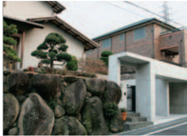
【エクステリア全景】 シャープでモダンなコンクリート打ち放しのガレージ。門まわりと30年の年輪を感じさせる苔むした重厚な石組の対比がまさに絶妙。和風の住まいや松などの樹木とも美しく調和しています。