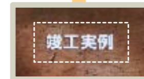
「竣工実例」をタッチすると...