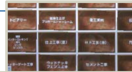
さまざまな工事の項目が 一覧に。