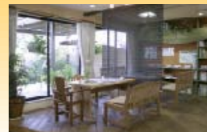
ショールームの相談スペース。 ナチュラルな木調が暖かく、くつろいで 話し合いができます。窓からエクステリアの サンプルプランも見えます。