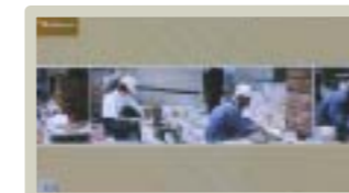
工事の手順や様子も見られます。 これは「石貼り・石積み工事」の様子。