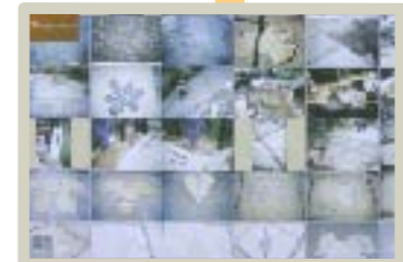
さまざまな岩床仕上げの例が画面に。 さらにタッチすると...