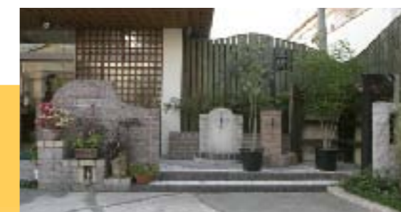
入り口正面には、おしゃれなデザインで 門柱や立水柱のサンプルプランを提案。