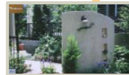
その写真を画面いっぱい大きく見せてくれます。