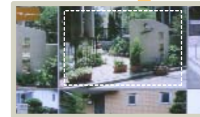
実例写真がたくさん画面に出ます。 その中の見たい写真をタッチすれば...