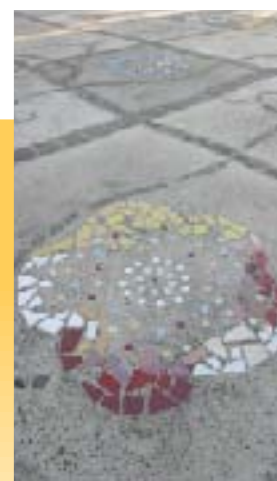
広い前庭は 駐車場になっていて、 床にはさまざまな素材で モザイク模様が。