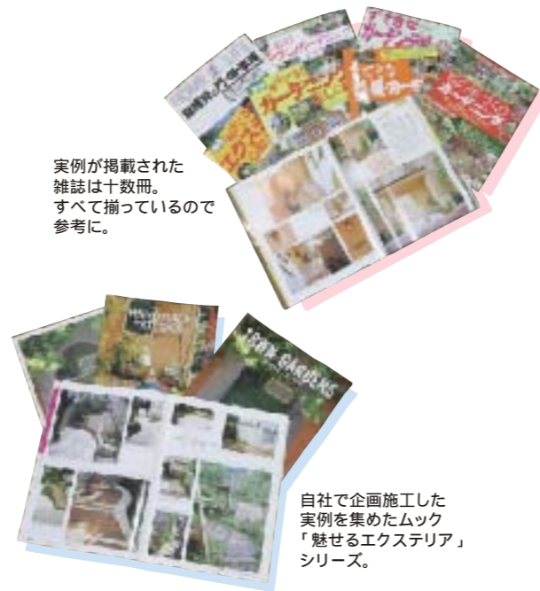
実例が掲載された雑誌は十数冊。すべて揃っているので参考に。

42インチの大画面で、当社のエクステリアの実例写真や施工の手順、素材や仕上げの情報などが見られます。画面に軽くタッチするだけで、目次から見たい項目を呼び出したり、表示された画像を拡大することも可能。操作が簡単なので、お客様が情報を自由に見て参考にできます。画像も美しく鮮明です。