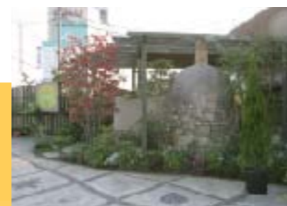
ショールーム外観。植栽や寄せ植えが美しい。 この裏側にガーデンテラスがあります。