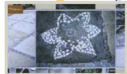
その一部を拡大して見やすくしてくれます。