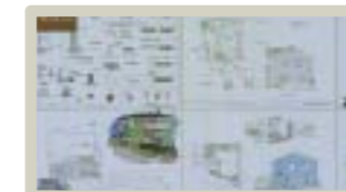
パーツの図面なども見られるので、 細かく確認もできます。