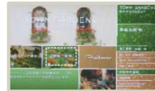
最初は目次が出るので、 たとえば「施工例」をタッチすると...