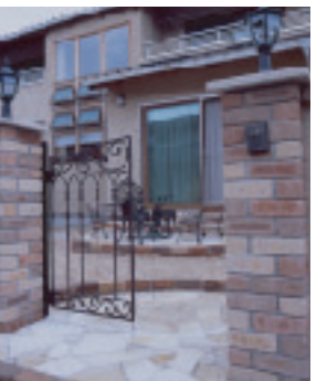
【門扉アップ】 レンガの門柱と乱張りの床が印象的。 門扉「アルディーク」がレトロな雰 囲気を演出しています。