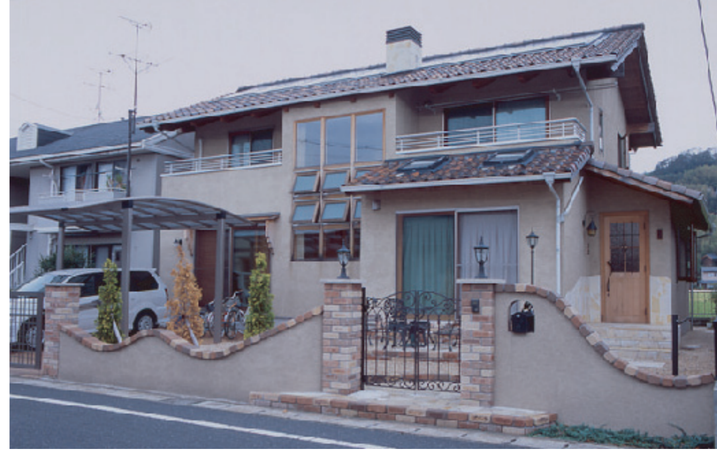
【全景】 ナチュラルでややクラシカルな家としてし 調和したエクステリア。塀のなだらかなウエ ーブが、遠くの人をやさしく包みます。カー ポートは「マリドワイド」、ゲートは「エ クモア3型・ワイドタイプ」を採用。