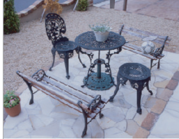
【テラス】 天然石を乱張りしたテラス。 お子さんが遊んだり、バーベキューをしたり、一家のくつろぎスペースに。