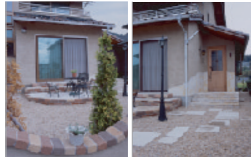
【塀越しに庭をのぞく】 ウエーブの低いところから、 庭を見る。このオープン感覚が また魅力。