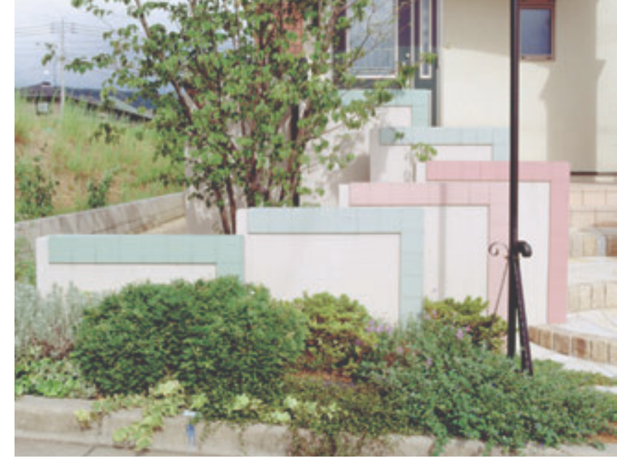
B様邸 やさしいリズム感で迎えるアプローチのパネル。

7人という大家族のT様邸のご要望は「車が2台置ける駐車場と、自転車が5～6台置ける駐輪場を設置したい。また、おばあちゃんがちょっと腰掛けられるベンチがほしい」といったものでした。そこで、カムフィアワイド(アーバングレー)で駐車場、駐輪場(エクレージ)を設置。スタイリッシュなグレー色が建物にマッチし、重苦しさのないやさしい空間をつくっています。駐車場～駐輪場～玄関まで屋根つきなので、濡れる心配がないのも好評。玄関にはお客様と会話を交わしたりできるベンチを置きました。(社長様談)アールのついた塀のやわらかいラインが印象的で、間からのぞく植物とのバランスも絶妙...訪れる人をやさしく誘ってくれます。ご主人も「よそと全然違うものになった」と大変満足されています。