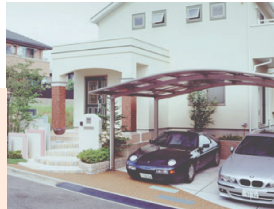
B様邸 2台の駐車場とアプローチのバランスも絶妙。床も玄関やカーポートのアールデザインと同調させ、楽しいイメージを創出。

高さの違う塀をパネルのように立てた、ユニークなアプローチ。タイルはパステルカラーのグラデーションで遊び心いっぱい。高低差や曲線を巧みに組み合わせ、狭いスペースに奥行き感を出しています。