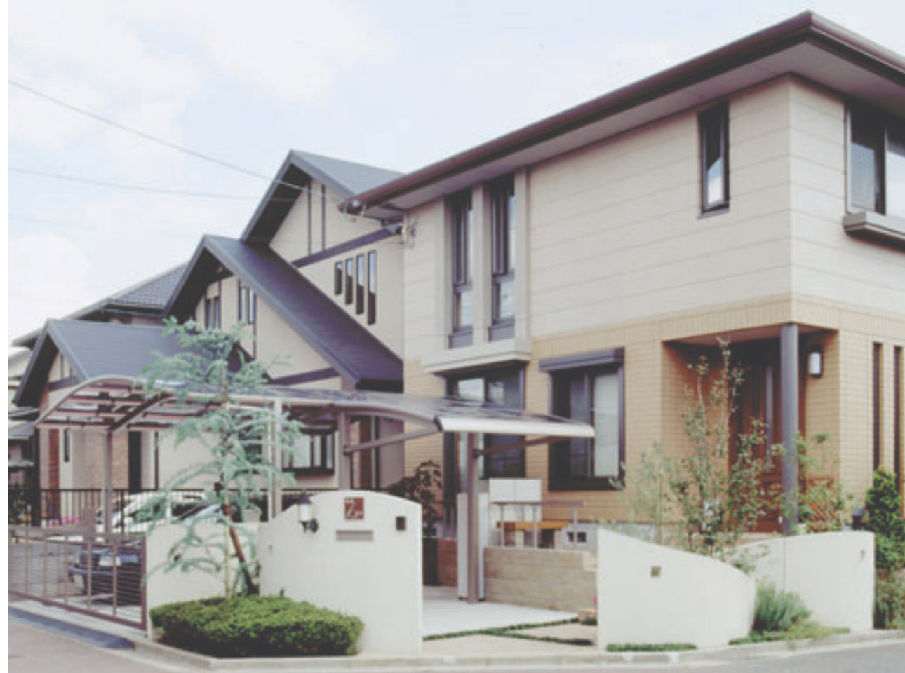
T様邸 駐車場と駐輪場。跳ね上げ門扉など、ライト感覚のグレー色が建物と調和。