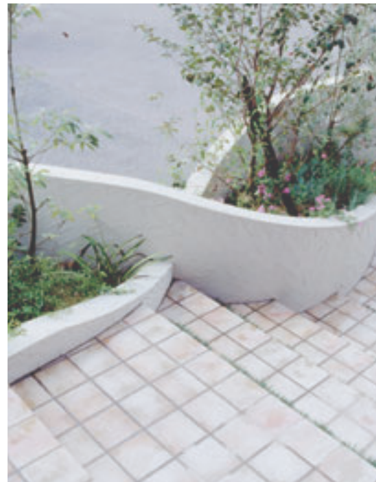
メロディアスな塀と植栽の連なりが訪れる人をやさしく誘う。