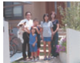
笑顔の絶えないご家族。広い駐輪場にお子様達も大喜び。