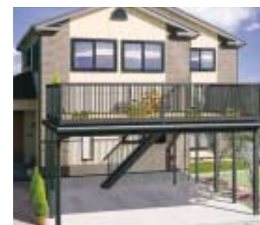
ビッグバルコニー スペースを有効活用!! さまざまな利用方法で、ビッグ バルコニーは大活躍。