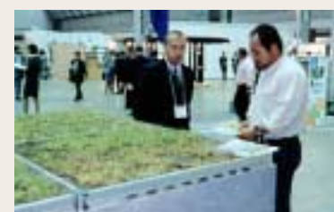
ヒートアイランド現象を抑える「未知草」