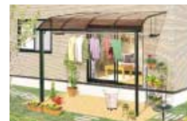
グッドエバー 生活空間の必需品として、 より快適な暮らしを実現。