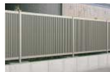
目隠しフェンス フレンド 隣地との境界線や道路側から の視線を遮るのに最適な目隠 しタイプのフェンス。視線を 遮りながらも光を取り込む採 光パネル（ポリカ製）も設定。