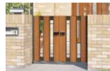
形材門扉「ラミーネ」 落ち着いた雰囲気を出し出す 木目調を取り入れた高級感の あるデザインが魅力。