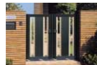
形材門扉カムフィDX