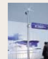
風力発電による照明灯