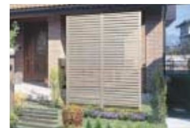
ガーデンスクリーン 「U.スクリーン」 隣家や道路側からの視線を遮 るスクリーンパネル。採光・ 目隠し・採風タイプ等のさま ざまなパネルを用意。