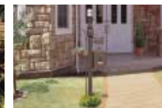
機能ボールアルティーク