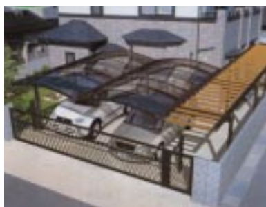
梁置きタイプ...R屋根 + R屋根 + パーゴラ屋根