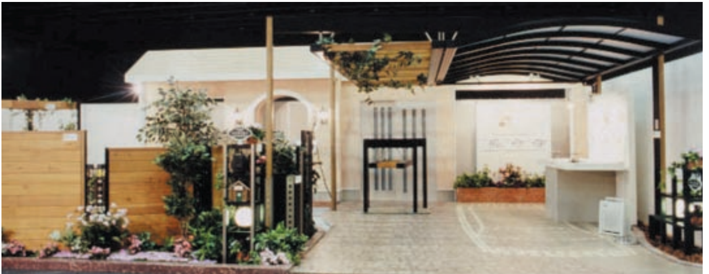
メロディアとユー・スタイルでまとめた提案（東京会場）

ガーデンエクステリア今春の新商品は、街並み景観と住まいごとの個性的な表現を両立させるエクステリアファサードシステム「メロディア」第2弾と、メロディアと調和させながら魅力的な空間をつくる新シリーズのユニバーサル・エントランス・システム「ユー・スタイル」。これで、エリアごとのコーディネート商品が充実し、調和した街並みや個々の生活スタイルに合わせたプランをご提案いただけます。開発担当者から、それぞれのプランニングの考え方などをご案内いたします。