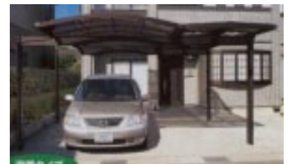
梁置きタイプ...R屋根 + ガラス屋根（アプローチ）