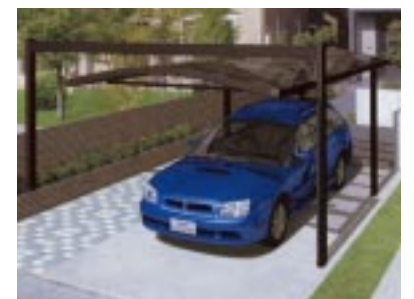
前吊下げ・後桁取り付けタイプ...R屋根