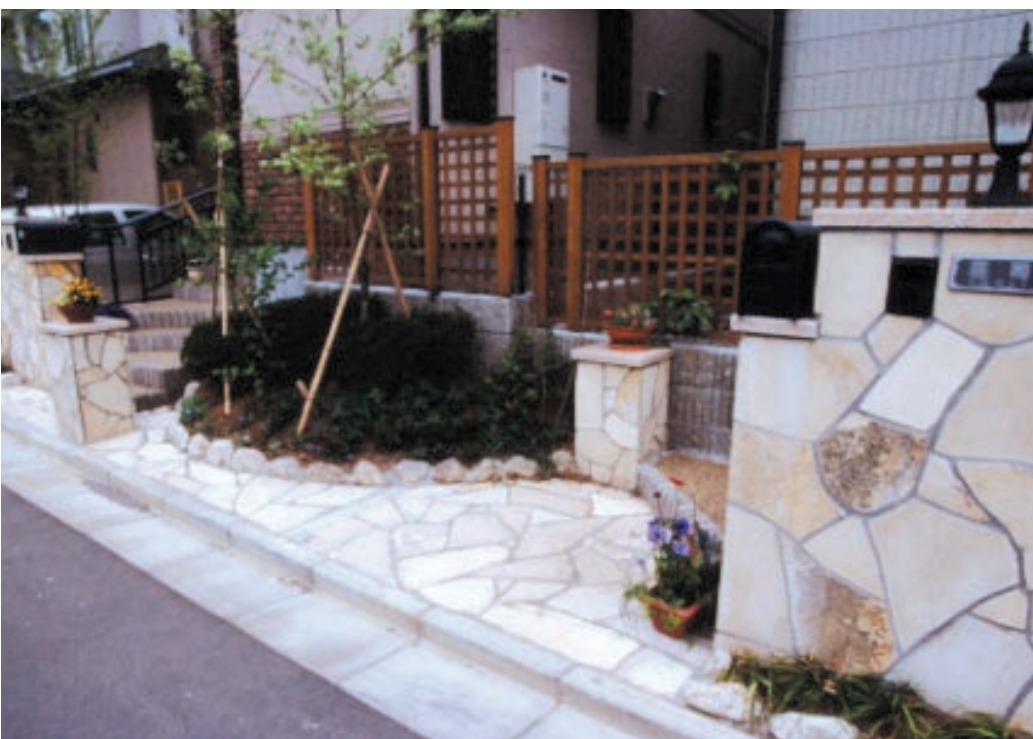
自然素材やアールを取り入れたデザインが、 ホッとできるような優しい雰囲気を感じさせる。