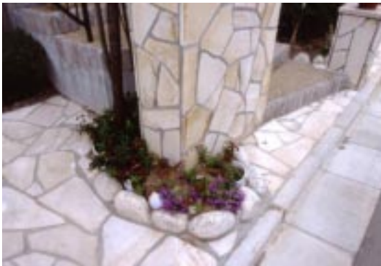
門柱と床は、ソルフォーヘンという石を切って乱張りに。 植栽を引き立たせると同時に、エクステリア全体を明る くおしゃれに仕上げるキーポイントになっている。