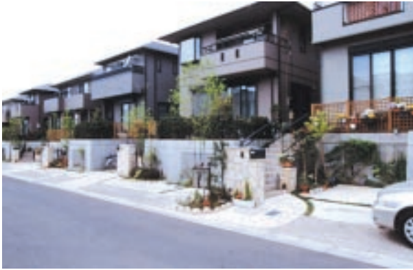
千葉県千葉市 「青葉の森の街」の街並 それぞれの住宅によって変化をつけながらも、 素材と意匠、植栽を統一したエクステリア を構築。道行く人の目を楽しませる、美し い街並が続いている。