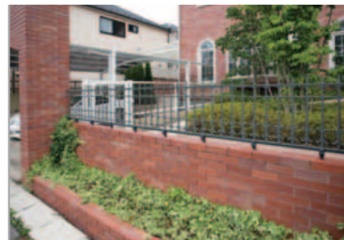
【フェンスまわり】 レンガだけだと重くなりがちなので、繊細な鋳物フェンス・キャストモア4型で軽やかに。足元のアイビーのグリーンが鮮やかなアクセントに。