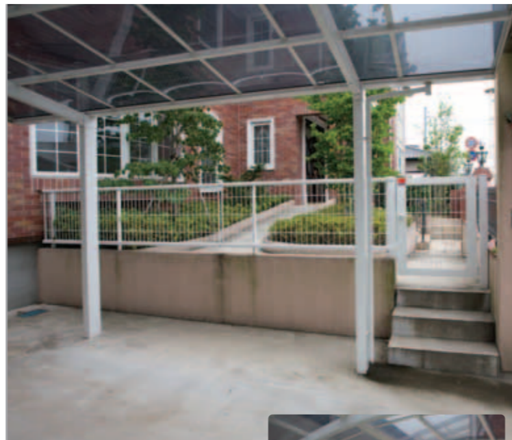
【カーポートからのアプローチ】 カーポートの右脇の階段を上ると、玄関への近道がつけられています。門扉はカムファイ、フェンスはニュータウンリード。

「網谷ホームさんは輸入住宅のエクステリアを多く手がけているので、信頼しておまかせしました」とご主人。要望は「スロープをつくってほしい」「中庭にテラスがほしい」ぐらいだったとか。完成したエクステリアは、建物と同じレンガや鋳物を使って、建物の風格に負けない重厚感のあるものに。もちろんスロープもテラスも実現。「さすがプロの仕事」と大満足のご主人でした。