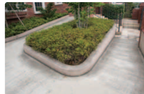
【スロープのアプローチ】 カーポートからのアプローチは、車椅子を使う家族のためのスロープに。右側のスロープは玄関の階段下へ、左側のスロープは玄関の階段上へつながっています。