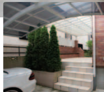
【テラスで家族団楽】 カーポートの奥には屋根つきのテラスが設けられ、家族のアウトドアリビングとして活躍しています。