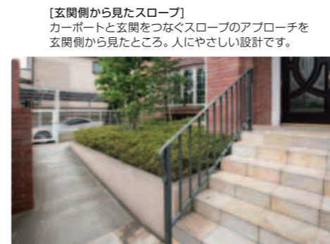
【玄関側から見たスロープ】 カーポートと玄関をつなぐスロープのアプローチを玄関側から見たところ。人にやさしい設計です。