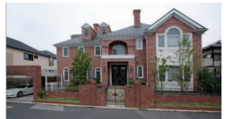
【エクステリア全景】 レンガ造りの重厚な外観が印象的な洋館。エクステリアも建物と同じレンガを用いて、全体が一体感のある外観に。