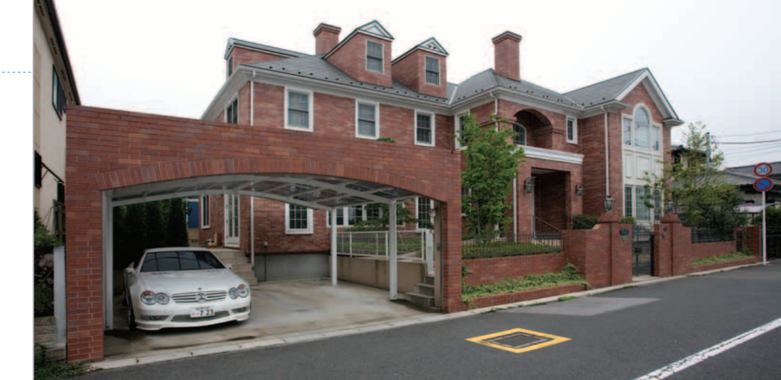
【カーポートもコーディネート】 カーポートにはカムファイRワイドを採用。前面のシャッターゲートはオリジナルでつくったもの。カーポートの屋根に合わせてアールにデザインし、建物と同じレンガを張って外観を統一。