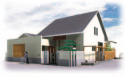
塀に変化をつけてセミクローズな外観に Y様邸

防犯も考えてクローズなエクステリアと電気錠を、という施主様の希望に沿いながらも、閉鎖的になりすぎないように工夫し、木の塀や穴あきブロックでライトな感覚をもたせたエクステリア。塀はとこるところオープンにするなどデザインに変化をつけ、内側に坪庭をつくる遊び心も。