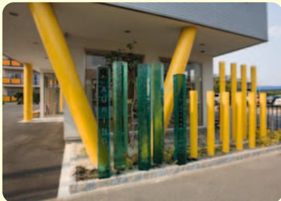
【エクステリア外観】 カラフルな黄色と緑の柱が印象的なショールームに。この柱は、人目を引かせるだけでなく、さりげなく道からの視線を遮る役目も果たしています。

店舗の仕事も増えてきています。これは住宅メーカーのショールームのエクステリア。建物のV字の柱を生かし、黄色い柱と透明な緑色の柱をリズムミカルに立て、明るくポップな外観を演出して人目を引きつけ、集客をはかっています。