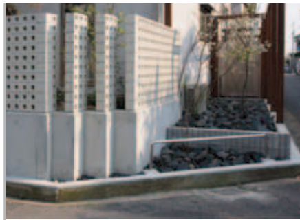
【コーナー部分の工夫】 角を落として木を植え、軽快な雰囲気。塀のブロックは穴あき仕様のものを使い、さらにコーナー部分にスリットを入れています。視線を遮りすぎないほうが、防犯にも効果的。

防犯も考えてクローズなエクステリアと電気錠を、という施主様の希望に沿いながらも、閉鎖的になりすぎないように工夫し、木の塀や穴あきブロックでライトな感覚をもたせたエクステリア。塀はとこるところオープンにするなどデザインに変化をつけ、内側に坪庭をつくる遊び心も。