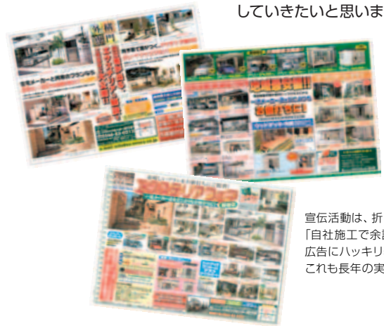
宣伝活動は、折り込みチラシや新聞広告で。「自社施工で余計なマージンなし!」と広告にハッキリ表示。これも長年の実績と自信のあらわれです。