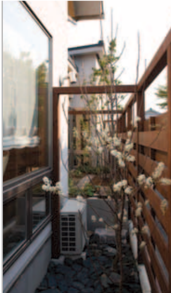
【坪庭】 木製の塀の内側には坪庭がつけられ、風呂場から楽しめるようになっています。