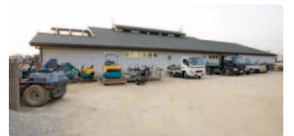
ダンブカー7台、重機6台を自社保有。なので工事日程も立てやすく、施工もスムーズ&スピーディです。