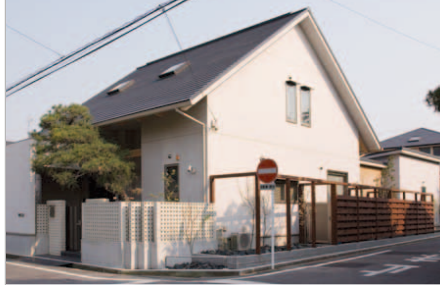
【エクステリア全景】 左側はタイル、右側は木製の塀で変化つけた外観。コーナー部分をオープンにしたことで、閉鎖感のない親しみやすいエクステリアになりました。