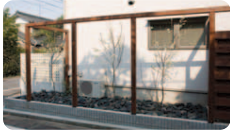
【木製の塀】 長い木製の塀は、両端がオープンになっていて、そこに木が植えられ、やさしい雰囲気をつくっています。