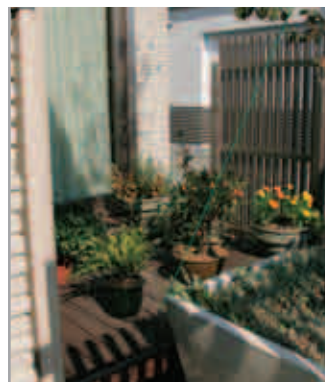
【タテ柵の塀とリビングデッキ】 外からの視線を遮りながらも、柔らかな曲線と透かし具合が絶妙で、重くならない仕切り。タテ柵の塀の内側は、樹木の大鉢とリビングのデッキがあります。