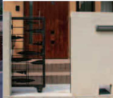
【門まわりの工夫】 スペースのない門まわりに重宝な引き戸の門扉。門柱の下の小窓は、この位置に水道メーターがあるため。こうすれば水道の検針も外からできるし、おしゃれなワンポイントにもなり一石二鳥。