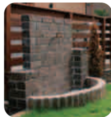
【オリジナルの立水栓】 奥の芝生の庭には、レンガを積んで立水栓をつくりました。夏はお子さんの水遊びの場にも。