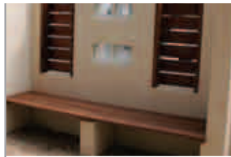
【塀の裏はベンチに】 リビングの窓の外に、濡れ縁と対面するように設けられたベンチ。お子さんが外遊びで利用したり、プランターを置いても。