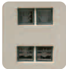
【思い出の手形】 塀にはめ込まれたガラスブロックは、内側にお子さんたちの手形が彫られています。家族の大切な思い出になる、遊び心たっぷりのアレンジ。