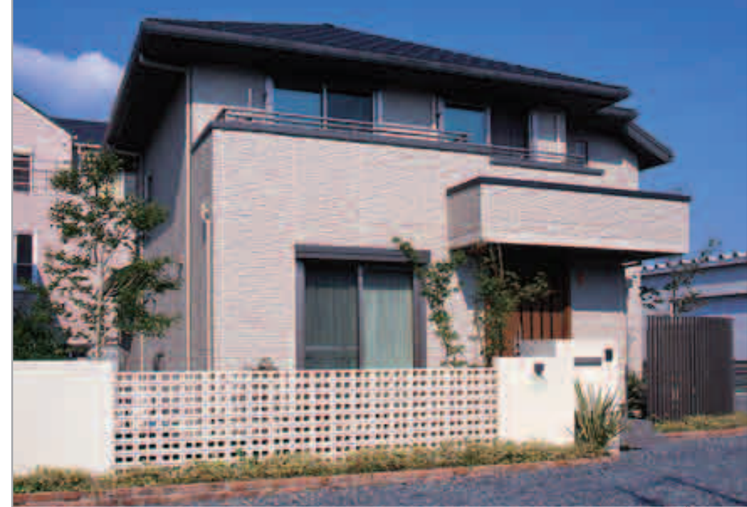
【エクステリア全景】 白い片側門柱と、グレイッシュな木製のタテ柵の塀、そのコントラストが美しいエクステリア。穴あきブロックの透けた感じが軽快。