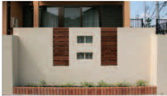
【塀の段差】 リビング前の塀は一段高くなって、視線を遮り、プライバシーを守っています。

施主様からの要望は「クローズにして、外からリビングへの視線を遮ってほしい」。しかし、ただクローズにしてしまわず、庭の見せてもいい部分と隠したい部分に合わせて、塀の高さや材質を変え、メリハリをつけました。庭にはベンチや大きめの立水栓を設置して、ご家族が楽しめる空間に。