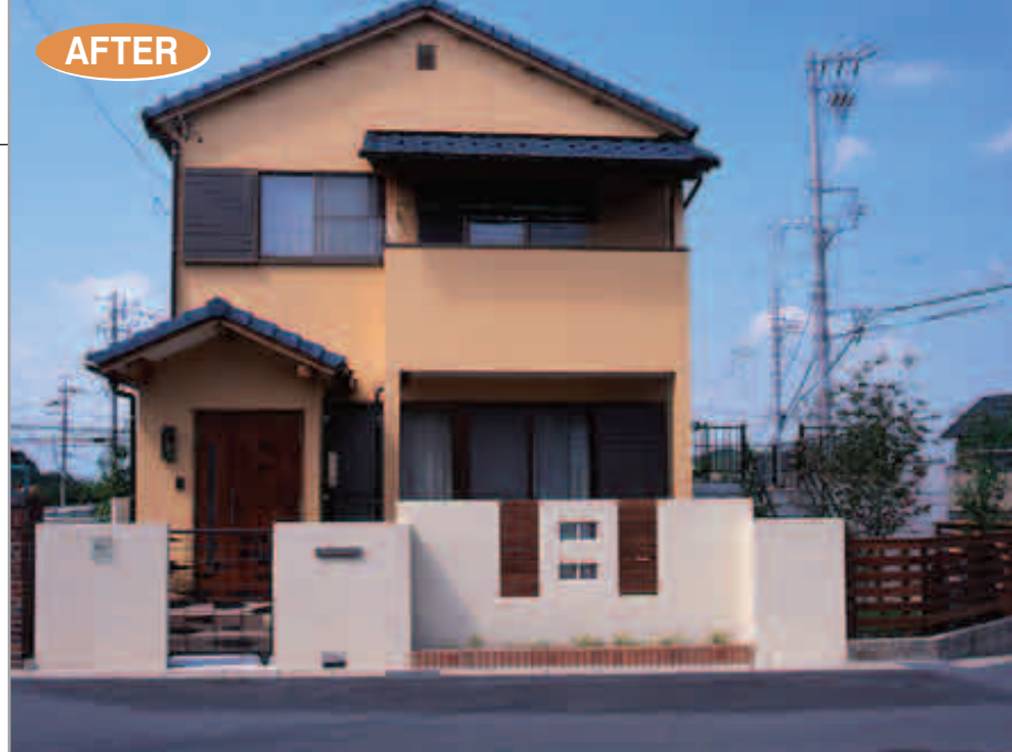
【エクステリア全景】 建物の壁面と塀の色を一緒にせず、それぞれの色が引き立つような組み合わせに。塀の塗り壁と木製のコントラストが美しいアクセントになっています。