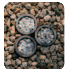
【丸瓦+白砂利でアクセント】 和の庭の砂利には、こんな遊び心も。丸い瓦の中に白砂利を入れて。