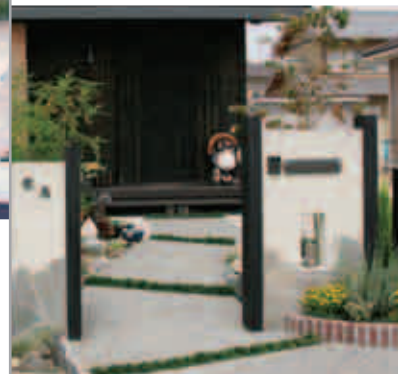
【門から玄関へのアプローチ】 白い塗り壁と枕木をあしらった端正な門柱が印象的。曲がりくねった道なので、玄関までの奥行きが深く感じられます。

「古民家風の建物に合わせた雰囲気」という要望にそって、モダンな新和風のエクステリアを提案。プランは何社か競合しましたが、デザインが一番気に入ってくださり、実現にいたりしました。家のデッキに使った木材の廃材を利用して、フェンスをつくったことも評価されたようです。建物のダイナミックさを生かしたシンプルなおープン外構です。