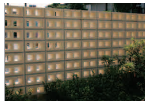
【庭からブロック塀を見る】 穴あきブロックは、内と外をやわらかく仕切ってくれます。