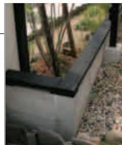
【ブロック塀の笹木】 ブロック塀の上にはデッキの廃材を利用して、笹木ふうに。こうするとブロック塀もチープに見えず、ナチュラルで落ち着いた雰囲気のお庭に変身。