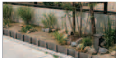
【植え込みの緑石には瓦】 塀の外側は植物の植え込みに。緑石には屋根瓦が使われ、和の雰囲気をつくっています。