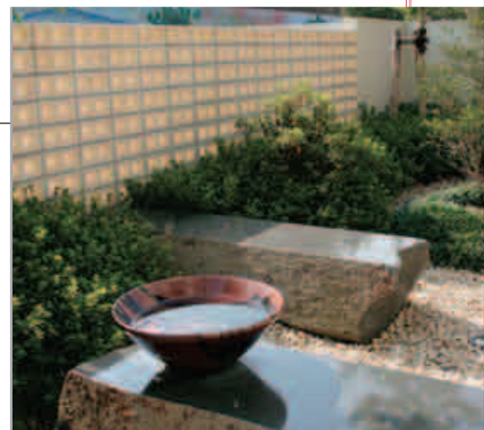
【新感覚の和の庭】 長方形の石は六方石、ベンチにも使えます。水鉢をつくばいふうに置いて雰囲気づくり。

写真館を経営する施主様は、広い敷地の奥にはスタジオも併設。敷地内に車が入り出すので、目隠しの塀を設けました。ただし圧迫感がないように透けたものを使用。エクステリアは基本的に「全部おまかせ」だったので、和の庭など遊び心たっぷりに提案しました。今後、あいている敷地に野外スタジオとしてパティオをつくる計画もあるとか。