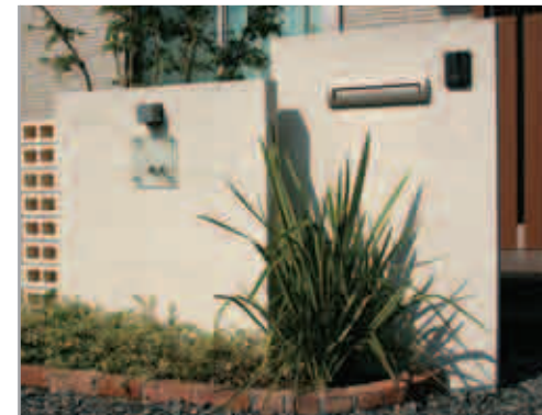
【片側門柱】 2枚の高低差がリズムカルな門柱。玄関のさりげない目隠しも兼ねています。