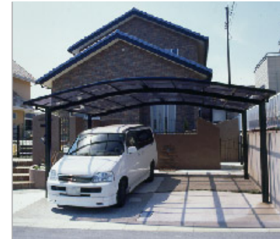
【カーポート】カムファイRのカーポート。美の立水栓は車を洗うために設置。右奥の出入り口は、種から直接玄関に行けるので、買い物の荷物が多いときや雨の日も重宝です。