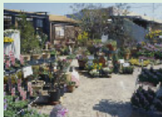
事務所に併設したフラワーショップは、エクステリアやガーデンのショールームとしても活用。

スタッフは、(有)ハマタケと共通で、設計4名、外構工事2名、建築工事1名、経理2名、フラワーショップの店員2名です。実績は、合わせて月30棟ほどになります。当社のモットーは、エクステリアから建築・インテリアまでトータルに提案すること。普通はエクステリアだけ切り離されてしまうことが多いですが、外まわり+花+住まい+家具など、すべてをトータルで考えてこそ、調和のとれた美しい空間が生まれると思うからです。デザインは、ありきたりだけでなく、かつ普遍性のあるものを心がけ、さらにリサイクル素材を活用するなど環境にも配慮したいと思っています。