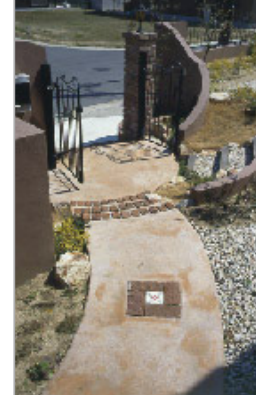
【玄関口から門を見たとこ】アプローチやステップ、塀などに曲線が生かされ、やさしくて居心地のいい空間をつくっています。アプローチの中央に埋め込まれたレンガの模様がアクセントに。