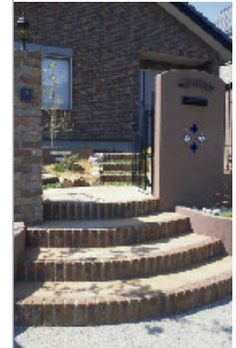
【アプローチのアーチ階段】レンガ造りのアーチの階段が、訪れる人を優しく迎えてくれます。門を入ると、左のステップは壁へ、右のステップは玄関へとアプローチが二手に分かれます。