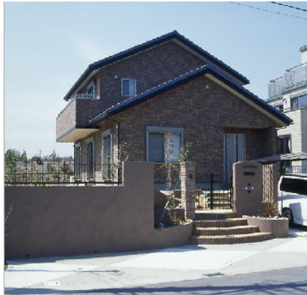
【外観全貌】レンガ風タイル造りの風格ある建物。その高さや色に合わせて塀の高さや配分を考えたので、全体のバランスが美しい。アシンメトリー(左右非対称)な門もおしゃれです。