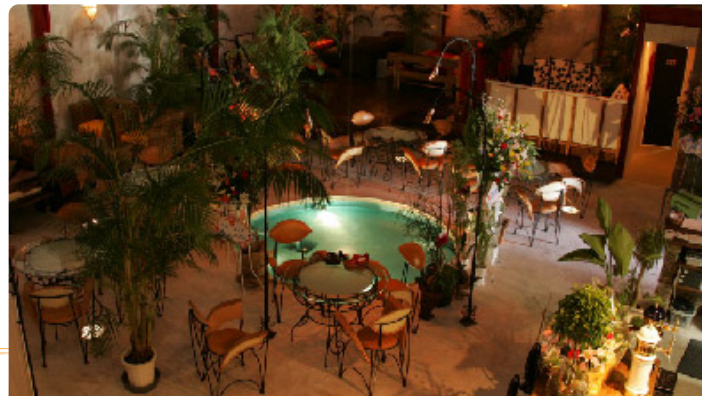
【店舗のインテリア】池をつくり育の植物を配して、海外リゾートホテルのガーデンのような雰囲気。家具や照明器具にもこだわった、おしゃれな空間です。

エクステリア・インテリア・家具・什器・小物選びまでトータルにプロデュースした店舗。倉庫の高い天井をダイナミックに活用して、ガーデンを室内に呼び込んだ、斬新な洋風居酒屋です。結婚式のパーティなどにも利用され、お客様の評判も上々です。