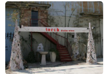
【店舗の入り口】池をつくり育の植物を配して、海外リゾートホテルのガーデンのような雰囲気。家具や照明器具にもこだわった、おしゃれな空間です。