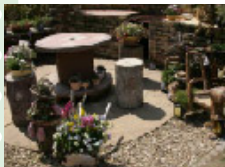
リサイクルの提案も。テーブルは軽便さを再利用して、古い三輪車も発光に。