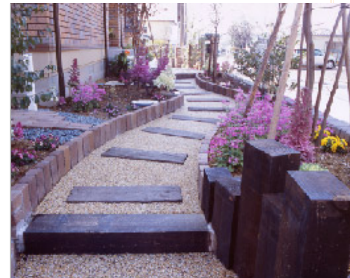
【駐車場側から見たアプローチ】 玄関アプローチは、そのまま道路と平行に伸びて駐車場の脇まで続いているため、子どもの通り道になっているそうです。駐車場側では木を使って雰囲気を変えています。