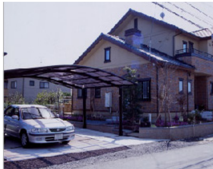
【駐車場側からの全景】 「カムファイR」のダイナミックなアール屋根と重厚な色調が、建物と美しく調和しています。