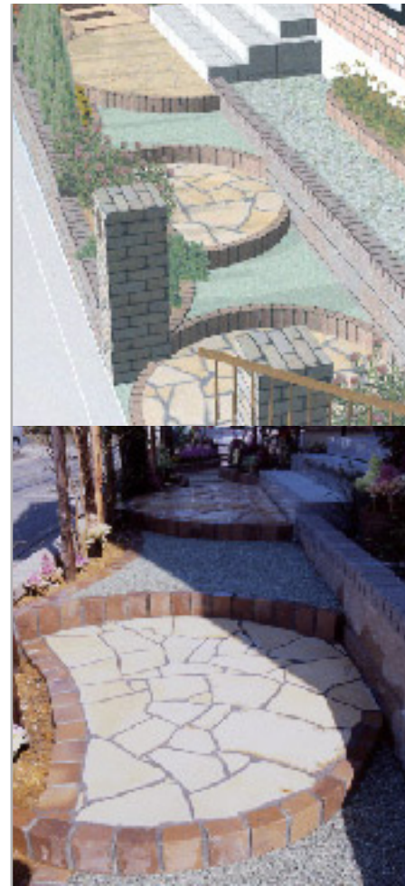
【玄関アプローチ】 高低差をうまく活用して、円形を組み合わせたユニークな段々を作成。天然石の乱張りやレンガなど素材もいろいろに使い分け、目を楽しませてくれます。