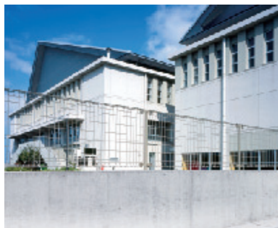
支柱の目立たないスタイリッシュなフォルム ユメッシュZ型 間仕切り支柱タイプ