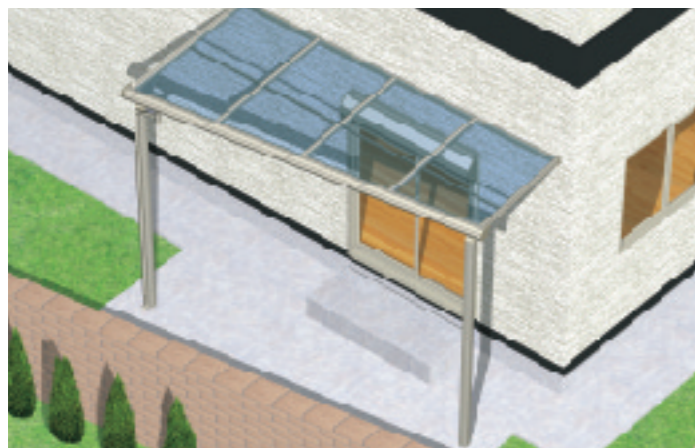
前面台形納まり部材を用意、変形地にも対応。 グッドエバーFn型 前面台形タイプ