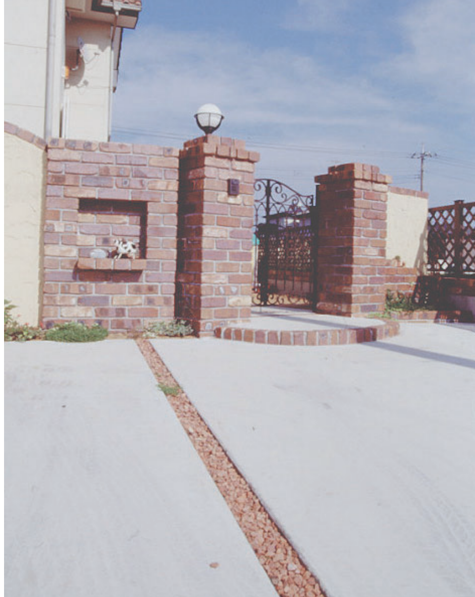
K様邸「好きなレンガを素敵にあしらった夢のあるフロントヤードが実現して、とても満足です」