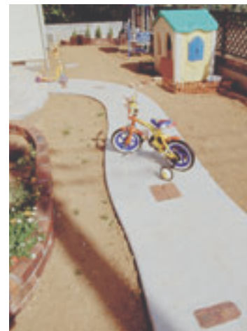
曲がりくねった小径が広がり感を演出。