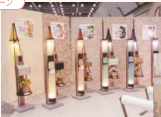
機能ボールにファブリックを新素材として取り入れた「ヌノアール」 “カラフルでおしゃれ！” 柔らかく感が素敵”と上々の反応

ファブリックの機能ボール、木質感の扉...若者の感性にフィットする新テイストを提案